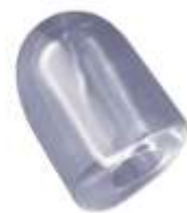
17 gr HOLLOW ICE CUBE