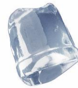
18 gr FULL ICE CUBE