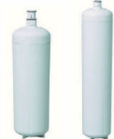
HF 60S HF 90S

- filtrazione a 0,2 micron Capacità filtrante 132.489 l Capacità filtrante 204.412 l - 0,2 micron filtration. Filter capacity 132.489 l Filter capacity 204.412 l